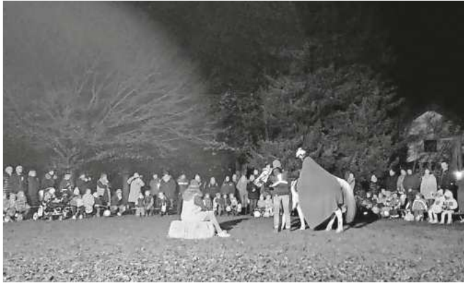
KINDERGARTEN ST. MARIA MINGEN

Der Elternbeirat sowie das Kindergartenteam möchten sich bei allen bedanken, die zum Gelingen dieser wunderschönen Veranstaltung beigetragen haben.